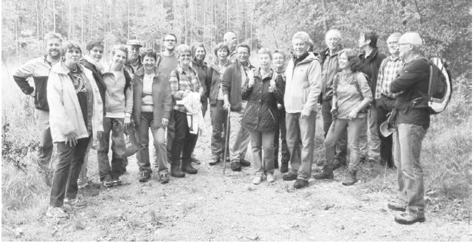
Rege Beteiligung bei der ersten Wanderung der neuen Wanderabteilung des FSV Erlangen-Bruck